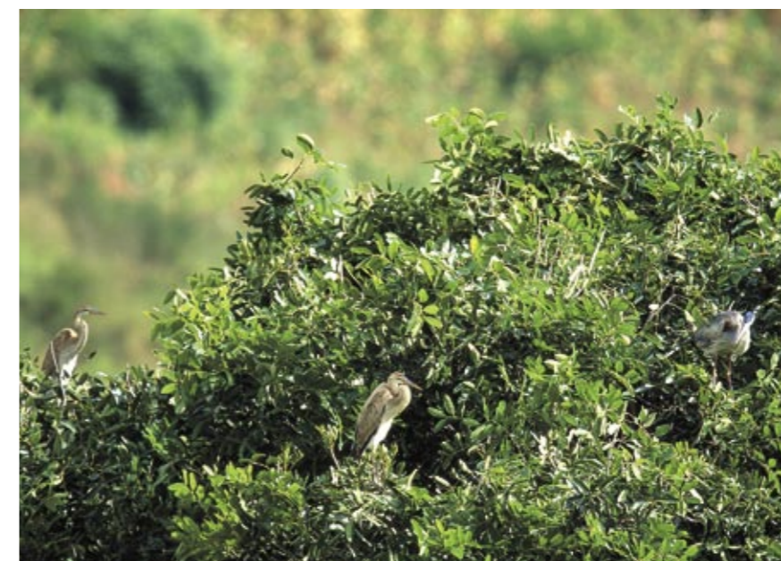
Vista parcial de la única colonia superviviente de garza imperial de Cabo Verde ( Ardea purpurea bournei ), ave relegada a la isla de Santiago que se considera en peligro de extinción. En la copa del árbol se observan varias aves juveniles.