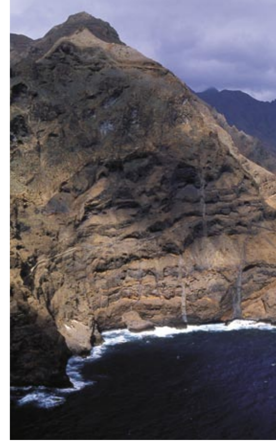
En ciertos acantilados e islotes existen colonias de pardela cenicienta de Edwards ( Calonectris edwardsii ). En la imagen, cantiles costeros de la isla de Sto. Antão.

con respecto al resto de las garzas imperiales del mundo.