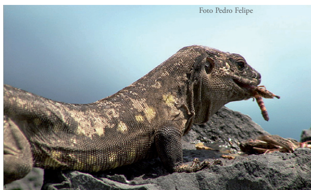
Figura 2. Macho adulto de Gallotia simonyi ingiriendo ortópteros regurgitados por gaviota patiamarilla ( Larus michahellis ) en el roque Chico de Salmor, isla de El Hierro (Canarias).

Las observaciones. En torno a las 11:00 se vio por primera vez cómo un lagarto, una supuesta hembra joven, ingería ortópteros muertos que habían sido regurgitados por un pollo de gaviota. A partir de ahí hubo más oportunidades de observar la misma conducta en otros individuos (de diferentes edades y sexos) en varios sectores de la meseta del roque, e incluso de facilitar el consumo —mediante la ubicación controlada de regurgitaciones— a ciertos adultos (Figura 2) para su filmación. Por lo general, la ingesta de los ortópteros era de uno en uno hasta finalizar, sin periodos de pausa ni desplazamientos de los lagartos implicados. Todas las regurgitaciones examinadas