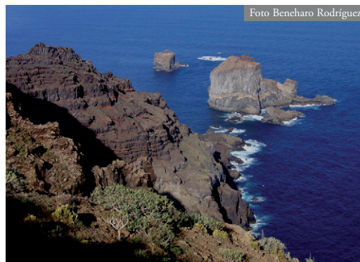
Figura 1. Desde la punta de Arelmo, costa norte de El Hierro (Canarias), vista de los roques Grande (en primer término) y Chico de Salmor.

La visita a este roque, efectuada el 27 de junio de 2008 (08:00-17:00 horas solares), tenía como propósito el seguimiento y rodaje de lagartos y gaviotas. Para ello se utilizaron prismáticos y una cámara de alta definición, así como “hides” para no interferir en el comportamiento de los animales.