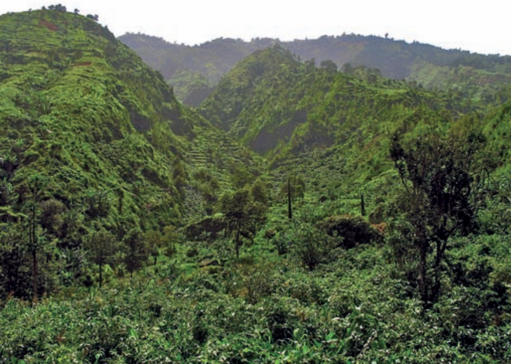
Wenn nicht anders angegeben: Fogo, Oktober 2006.

den NO-Passat verhältnismäßig viel Regen. Bei einem Jahresniederschlag von 1100 bis 1200 mm in 700 m Höhe wird hier der beste Kaffee auf dem Archipel angebaut. Unsere Untersuchungen haben nun ergeben, dass der Kapverdenrohrsänger fast ausschließlich im Kulturland, und dort vor allem in Kaffeeplantagen mit großen Fruchtbäumen, die auf Bergterrassen, in Tälern oder Kratern zwischen 300 und 1000 m angepflanzt wurden, verbreitet ist. Neben dem Kaffee bestimmen eingeführte Nutzpflanzen wie Mais, Orange, Papaya und Banane die Landschaft. Eine herausragende Bedeutung hat aber auch der Mangobaum, der von der einheimischen Bevölkerung als Schattenbaum und zur Fruchternte genutzt wird. Dem Rohrsänger dienen die Bäume als Singwarte und vermutlich wichtigster Neststandort. Wir fanden den Kapverdenrohrsänger in nicht genutzten Gebieten, besonders in schwer zugänglichen Schluchten – aber auch in dichten Beständen des aus Mittelamerika stammenden Wandelröschens. Ohne Erfolg blieb im Gegensatz hierzu die Suche in der oberen Bergregion, in einem mit Eucalyptus -, Cupressus - und Pinus -Arten sowie der Australischen Silberreiche aufgeforsteten Gebiet. Auf Santiago dagegen brütet der Kapverdenrohrsänger in derartigen Beständen in der montanen Region.