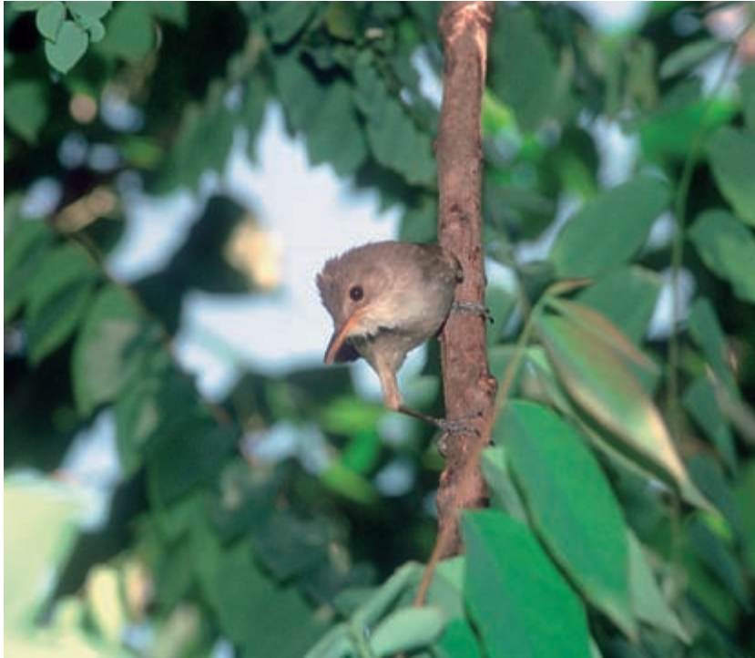
Auf Santiago, der Hauptinsel der Kapverden, ist der Bestand des endemischen Rohrsängers besonders durch Habitatverlust rückläufig. Foto: Santiago, Oktober 2004.

Vogelbeobachter. Die Teilnehmer der DO-G-Tagungen 2005 in Stuttgart wie auch 2007 in Gießen honorierten den Erfolg mit jeweils dem zweiten Platz im Posterwettbewerb.