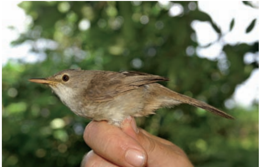
Der Kapverdenrohrsänger ist mit 13,5 cm etwas größer als der Teichrohrsänger, hat einen auffällig langen Schnabel und sehr kurze Flügel.

Vulkaninsel eingeplant, doch verlangte der Fund nun nach mehr Zeit. Wir stornierten den Rückflug, in der Hoffnung, weitere Kapverdenrohrsänger zu finden. Der Erfolg sollte