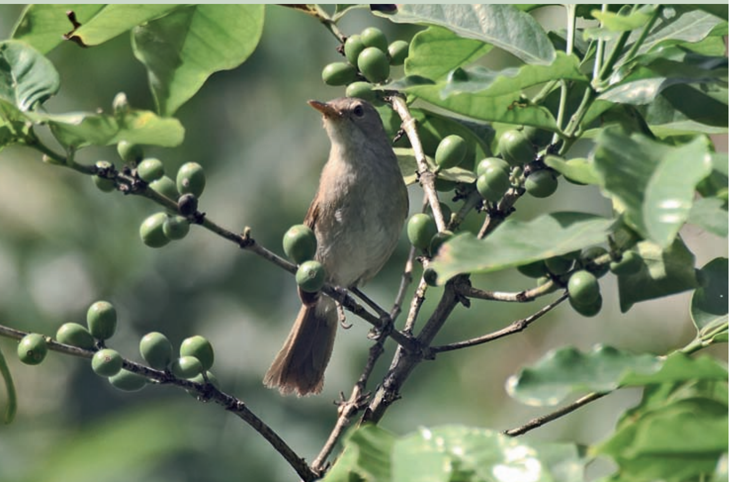
Kapverdenrohrsänger im Kaffeestrauch. Auf Fogo ist er in extensiv genutzten Kaffeepflanzungen verbreitet.

nicht ausbleiben. Am Ende standen 32 Reviere auf dem Papier, und die Vermutung lag nahe, dass die Inselpopulation sicher noch größer sein wird. Während eines Kurzaufenthal-