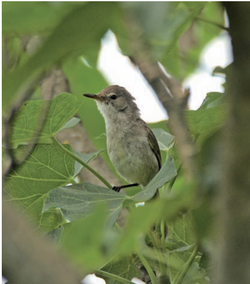
Heute leben schätzungsweise mindestens 500 Brutpaare auf Fogo. Auf der westlich gelegenen Nachbarinsel Brava ist der Kapverdenrohrsänger dagegen schon seit Jahrzehnten ausgestorben.

tes auf Fogo im Januar 2006 waren die Rohrsänger wieder nachweisbar, wogegen für die Nachbarinsel Brava nur der Status „ausgestorben“ bestätigt werden konnte. Im Oktober des gleichen Jahres fand schließlich eine von der Deutschen Ornithologen-Gesellschaft (DO-G) unterstützte Forschungsreise statt, deren Ergebnis alle Erwartungen übertraf. Jens Hering und Elmar Fuchs kartierten auf Fogo 129 Reviere. Dabei wurde schnell klar, dass aufgrund des vorhandenen Lebensraumes noch weitaus mehr Kapverdenrohrsänger im Norden der Insel zu erwarten sind. Einer Schätzung nach leben hier heute mindestens 500 Brutpaare. Die überraschende Entdeckung und deren Fortgang begeisterte aber nicht nur die beiden